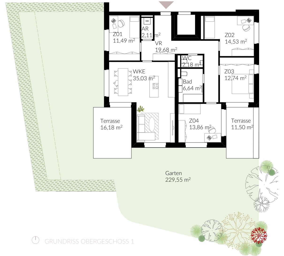
🕒 GRUNDRISS OBERGESCHOSS 1